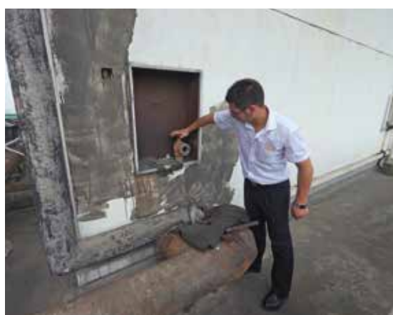
永庆坊屋顶消防水箱无水,消防栓不出水

楼的消控室,记者发现两台火灾报警控制器的屏幕上滚动显示着150余处故障信息,分别为感烟探头、感温探头、消火栓按钮等处故障。据消控室值班人员透露,整个火灾自动报警系统基本处于瘫痪状态,不但不能及时报告火情,反而常常发生误报报警现象。