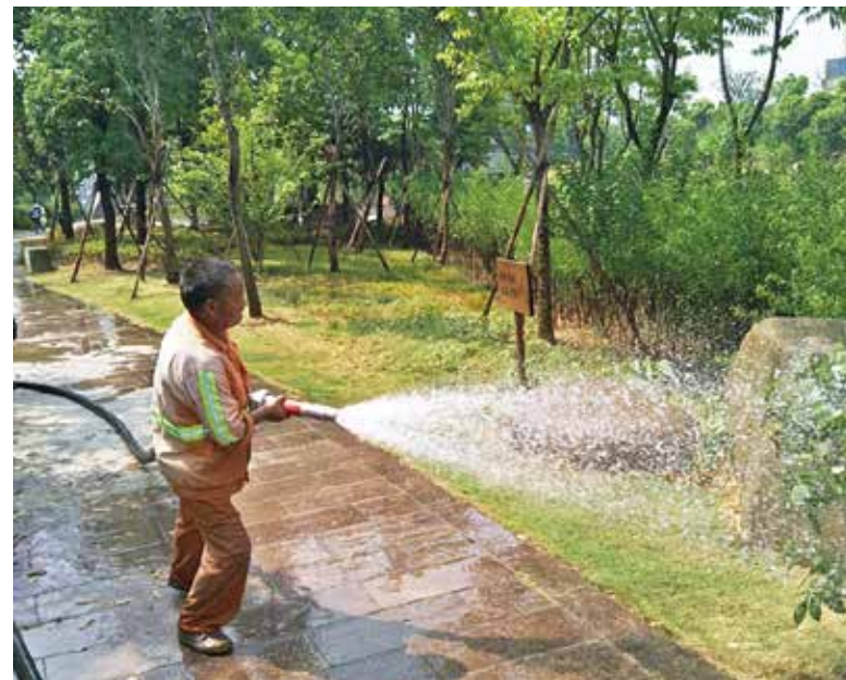
养护工人在高温下进行浇水作业

本报讯(通讯员 郭李飞)最近,杭州连日来持续高温天气,为了巩固绿化成果,确保绿化景观良好,区城管局明确要求把抗旱保绿作为今夏绿化养护管理的重点工作来抓。