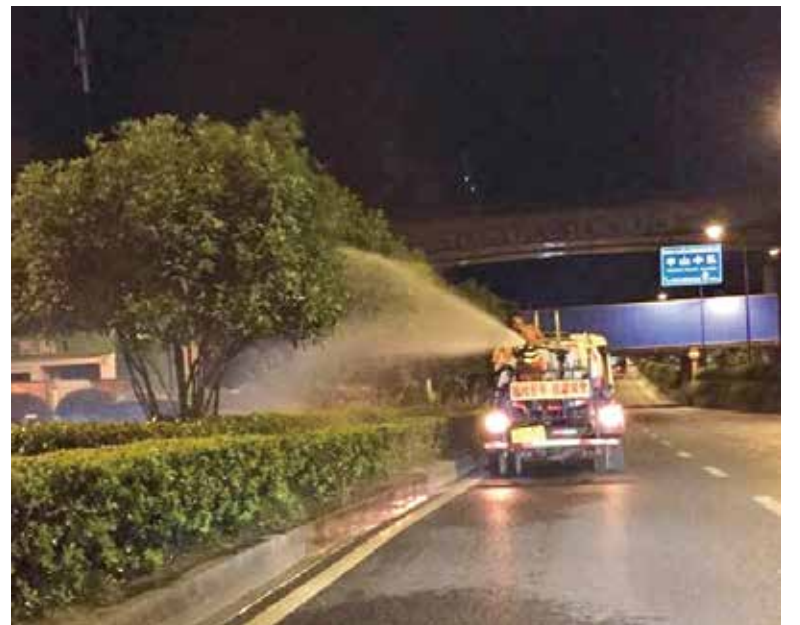
养护工人晚上加班加点进行浇水作业

量大,为保证浇灌效果,养护工人只能采取早晨早起和晚上延迟作业的方法,通宵抗旱,降低浇灌水的蒸发量。一般早上5点开始,作业至6点;晚上7点开始,有时会延迟至次日凌晨1、2点才结束。重点对杜鹃、龟甲冬青、乔灌