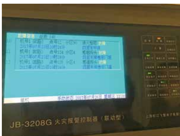
火灾报警控制器显示有故障148处

区物业进行求证。物业工作人员告诉记者,在该物业公司接手之前,消防设施就已经坏了,需要全面更新改造。但物业根本无法承担这笔费用,就一直拖到现在也没有解决,成了长久萦绕在物业和小区居民心头的一块心病。