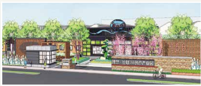
丝联166改造后入口效果图

今年以来,丝联166列入全区重点改造的五个文创园区之一。此次提升改造项目意在提升园区形象,改善园区的内外环境及完善配套设施。主要包括:园区东面整体景观提升改造、导示系统改造、园区停车系统的优化及完善、园区配套