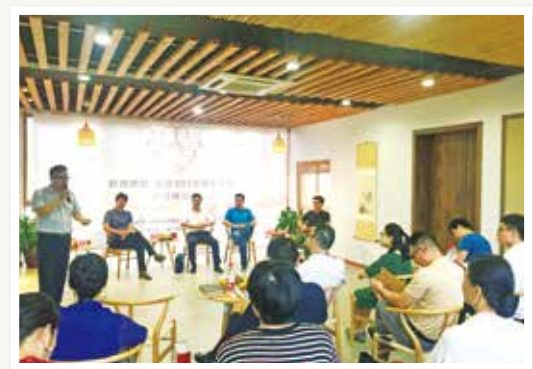
运河101文创会客厅活动现场

拱墅区运河101文创会客厅产业研习会,由区文创办和省创意设计协会联合办,是一个以研讨文创产业创新发展为主旨的自主学习型组织,主要围绕拱墅区文创产业发展特点、文创人才跨界融合与培养、文创金融创新模式等内容进行深度交流与探讨。