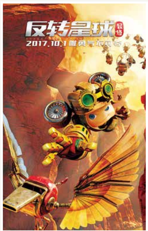
博采传媒出品的电影《昆塔:反转星球》全国上映

营造良好环境。 加大与杭州银行文创支行等金融机构对接,加大融资服务。支持各园区举办文化创意节、园区摄影节等活动,办好运河101文创会客厅。