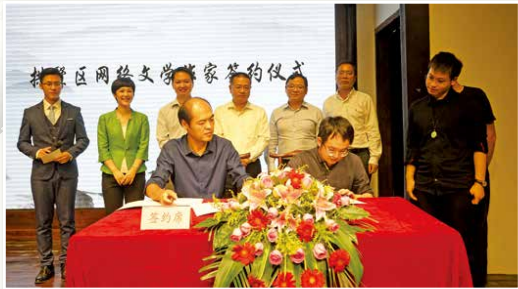
网络文学作家签约仪式