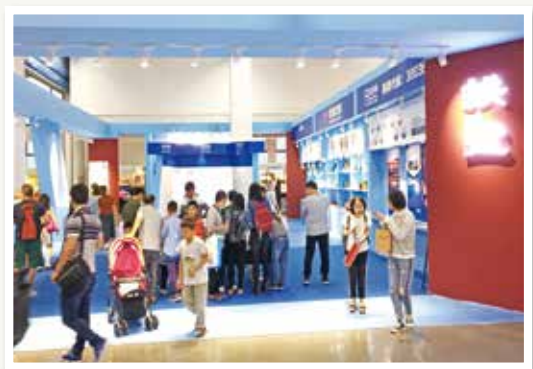
第十一届文博会拱墅展馆

今年的文博热情,还从白茅湖蔓延到运河边。作为今年文博会的重点项目之一,大运河非遗集市在运河广场开市。市集深入挖掘运河沿岸非遗文化资源,再现传统手作创新。36个展位,囊括