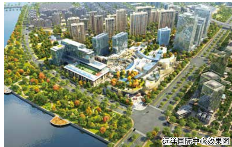
远洋国际中心效果图

据统计，近15年来，运河财富小镇范围共拆迁农户1113户、国有居民2939户、企业94家。小镇