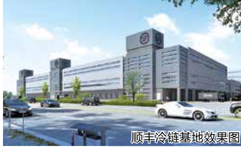
顺丰冷链基地效果图