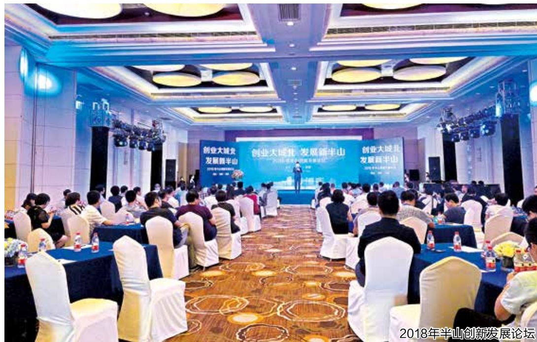
2018年半山创新发展论坛