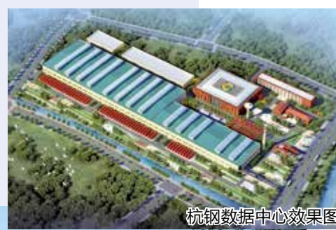
杭钢数据中心效果图