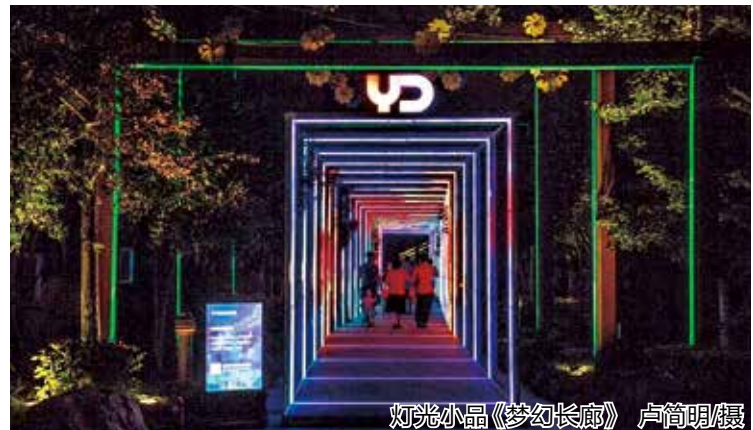
灯光小品《梦幻长廊》

本报讯(记者 韩菁)9月18日晚,以“筑梦古运·智慧光影”为主题的杭州灯光小品秀在运河天地拉开帷幕,通过与音乐、多媒体、装置艺术等多种表现形式的结合,营造独一无二的综合感官体验。