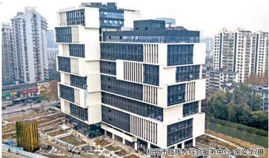
通讯员 杨艳 杨晓蕴

日前,作为市、区两级重点民生工程的杭州市肢残人综合服务中心,已进入单项验收阶段。该中心位于莫干山路与余杭塘路交叉口,紧邻余杭塘河。项目总建筑面积为3.8万平方米,总投资约3.5亿元,包括地下2层,地上16层。建成后,将成为市区现有规模最大的肢残人服务中心。