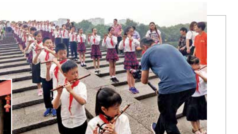
▲为喜迎新中国成立70周年、庆祝中国大运河申遗成功50周年,日前,2019年大运河文化节系列活动“奏响运河 献礼祖国”之“千人拱宸笛韵快闪”在拱宸桥畔精彩上演。 当天,千名笛乐爱好者齐聚《我的祖国》,众多围观市民和游客纷纷加入合唱,让爱国情怀在笛声和歌声中热意涌动。 杨瑾/文 杨于佳/摄

“没有共产党,就没有新中国……”近日,在激昂的歌声中,小河街道群众文艺展演活动在民星大舞台拉开序幕。 为庆祝新中国成立70周年,由区文化馆主办、各街道文化馆分馆承办、拱宸桥文化馆分馆协办的“运河大舞台”群众文艺展演活动,自5月底开始,每周六在拱宸桥畔陆续推出,展现了我区百花齐放的群众文化团队风采。 杨瑾/文 杨于佳/摄