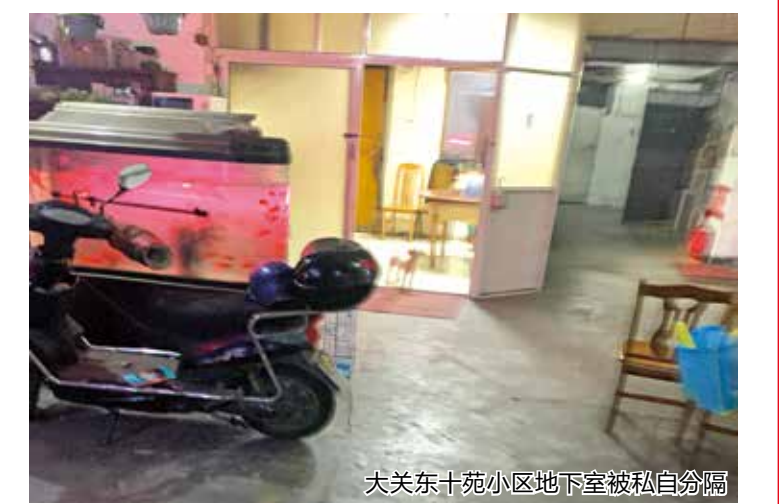
大关东十苑小区地下室被私自分隔

情况普遍,灭火器等消防设备缺乏,消防安全情况堪忧。 记者联系了所在的大关东二社区,社区工作人员告诉记者,这一情况确实存在,早在峰会时街道和社区便曾组织清查整改,但时间一久便又出现返潮。“因为社区没有执法权,刚性手段缺乏,这个问题就像埋在我们心中的一颗定时炸弹,希望可以早日清除。”该工作人员说。 老旧小区地下室,历来是乱堆乱放的“重灾区”,也是消防整治的“难上难”,但消防安全万无一失、一失万无,存不得半点侥幸。希望属地街道社区会同相关职能部门,对症下药、斩草除根,早日根治这一群众身边的心腹之患。