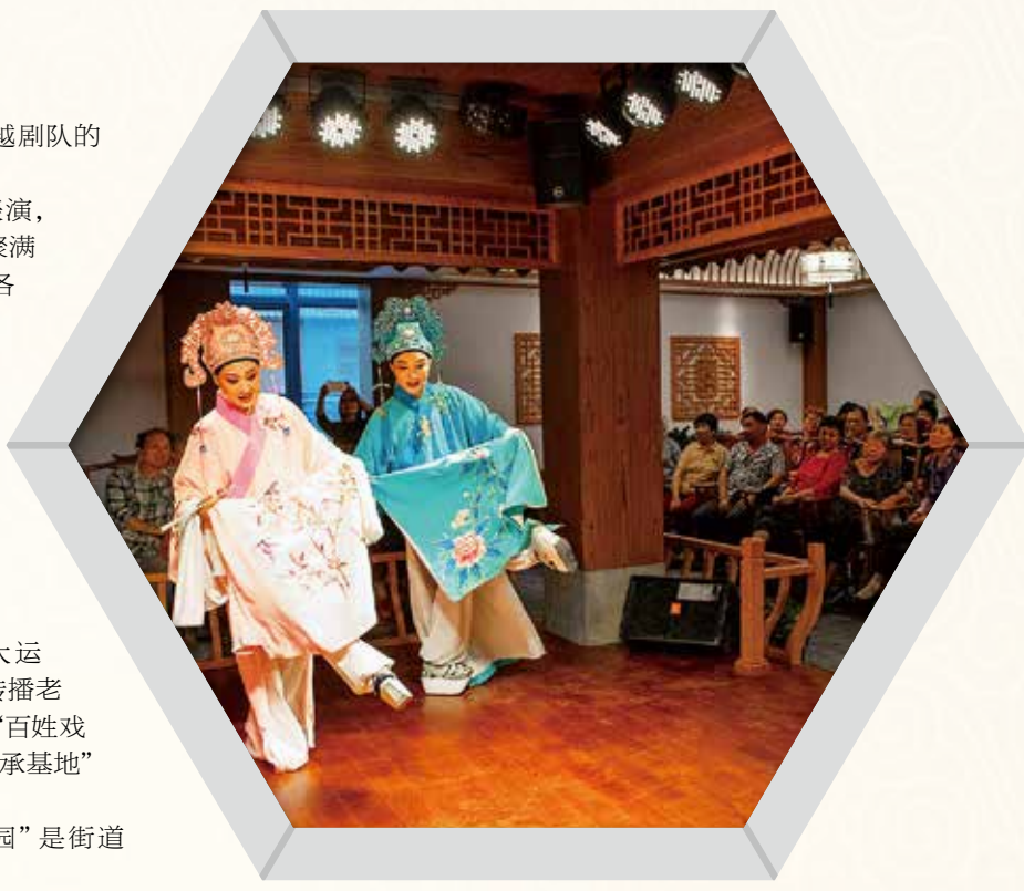
首届大运河戏曲节“星光璀璨”戏曲名家汇演在“百姓戏园”精彩上演