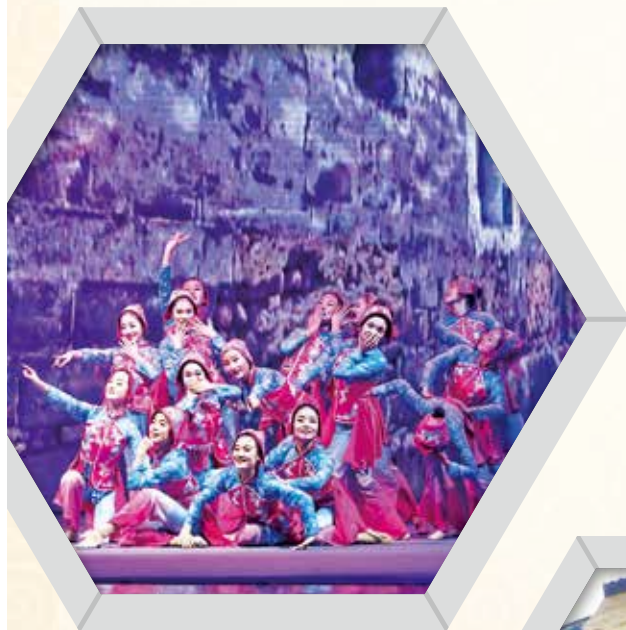
《大关印象》舞台剧现场