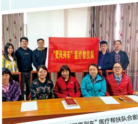
“墅凤列车”医疗帮扶队合影