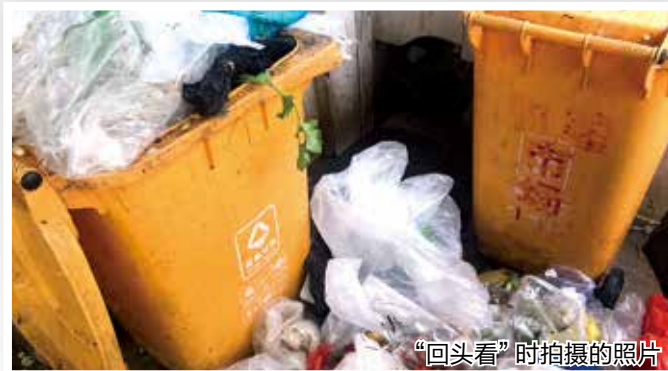
“回头看”时拍摄的照片

记者对问题整改情况“回头看”时发现,和睦农贸市场垃圾分类工作依然没有改善,黄桶内垃圾混投情况严重。