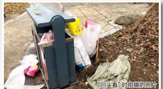
“回头看”时拍摄的照片

记者对问题整改情况“回头看”时发现,该公园仍然存在垃圾桶垃圾满溢、环境脏乱的现象。