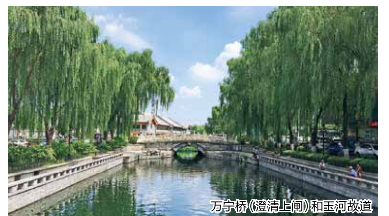
万宁桥(澄清上闸)和玉河故道

本报讯(通讯员 兰甜)通惠河始建于公元13世纪末(元代初期)，由郭守敬主持开凿，引北京昌平区白浮泉水作为水源，向西南流入瓮山泊。大运河北京段白浮泉至通州82公里，其中通惠河全长20.34公里，西起东便门的大通桥，向东经过乐家花园、高碑店、普济闸八里桥、通惠闸，在通州区北关闸接北运河。通惠河列入《世界遗产名录》的河道包括通惠河北京旧城段、通惠河通州段。