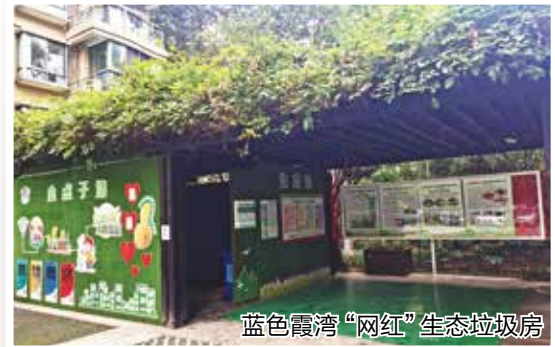
蓝色霞湾“网红”生态垃圾房