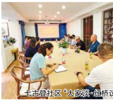
七古登社区“大家谈·红桥议事会”