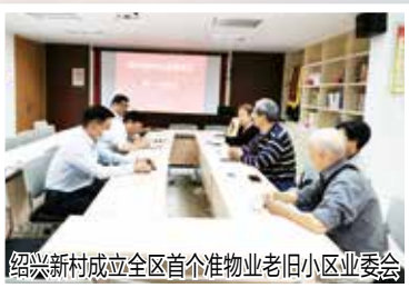
绍兴新村成立全区首个准物业老旧小区业委会

据悉, 今年街道还面向所有小区启动实施项目竞标赛, 拟通过三轮评比, 选出年度优秀项目。目前, 已有22个项目介入推动, 做到以群众的点评指数衡量治理成效。如专员入驻蓝色霞湾小区后, 协同物业方直面矛盾与不足, 细化升级“3do模式”, 垃圾分类集置点变身“绿意生态房”, 逆袭成为网红打卡点, 得到居民一致认可。