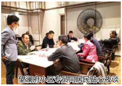
望澜府小区专员同居民贴心夜谈