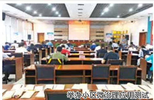
举办小区微治理应用测试