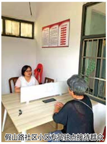
假山路社区小区专员驻点接待群众