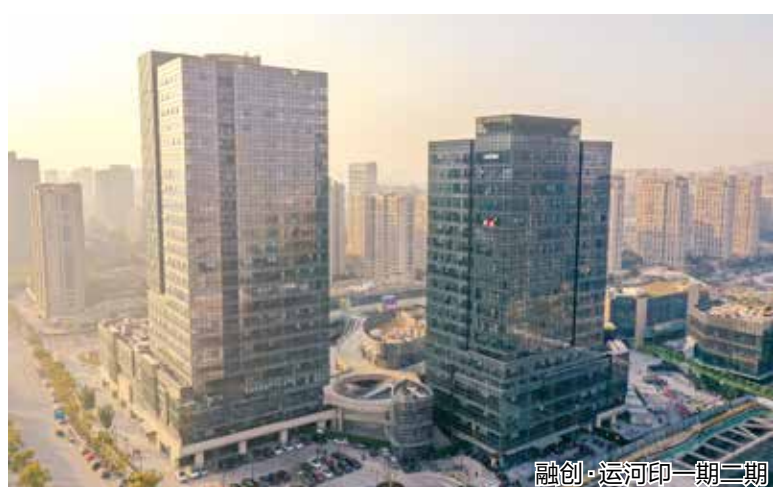
融创·运河印二期三期

本报讯(记者 梦诗三悦 通讯员 夏大为 祝依娜)城北人又有“夜嗨”新地标可以打卡了——融创·运河印商业部分InS.Park将于明年4月30日试营业。这也是自我区夜宵胜地胜利河美食街开街以来,家门口又一处能与之“遥相呼应”兼具夜生活特色的新去处。融创·运河印项目即原万融城项目,自开工建设以来一直备受杭城居民期待。