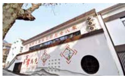
杭钢北苑阳光老人家

建设不断提速,占地825亩的杭钢工业旧址公园已经开工建设,石塘区块蓄势待发。64.43万平方米安置房建设全面推进。全面推进“两路一河”提升改造,实现还河于民、还路于民。