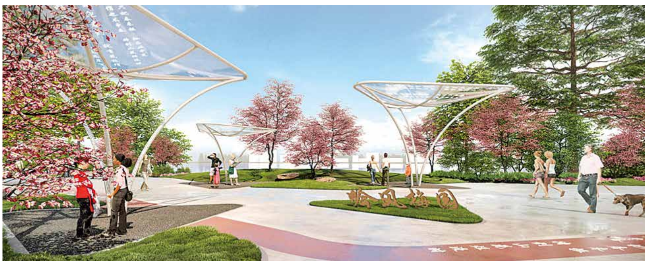
上塘河吟风梅园效果图

2020年,街道完成固定资产投资72.77亿元,实现财政收入7.98亿元,实际利用外资6445万美元。2021年1-2月,街道完成财政收入3.97亿元,地方财政收入2.17亿元,均同比增长50%以上。一季度完成固定资产投资12.91亿元,同比增长32.58%,实际利用外资2150万美元,同比增长100%,完成年度目标任务的30.7%。