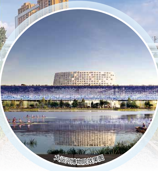
大运河博物院效果图

康桥街道东接320国道,西沿京杭大运河,南连石祥路,北靠绕城公路。街道面积12.8平方公里,下辖康桥村、谢村、平安桥、蒋家浜、吴家墩、独城、计家、永和、康桥、康运、康乐、西杨、义桥13个社区,康桥村、谢村、平安桥、蒋家浜、西杨、义桥、吴家墩、独城、计家、永和10个经合社,常住人口5.6万人。街道先后荣获“省突出贡献红十字基层组织”“省生活垃圾分类示范片区”“市无违建街道”等荣誉。