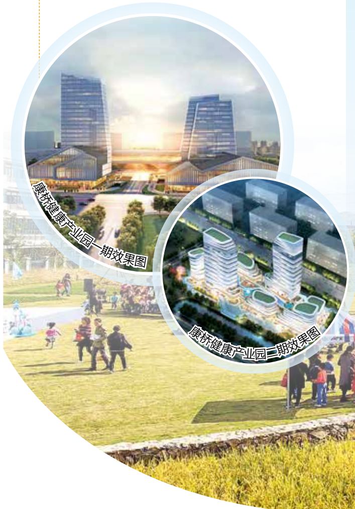
康桥健康产业园一期效果图

开展法治建设工程。建立健全法律服务体系,打造集执法片区、“小区大事”工作室、法治文化广场、矛调中心等于一体的法治平台,推动公共法律服务热线、法律服务网、公共法律服务工作站提档升级。