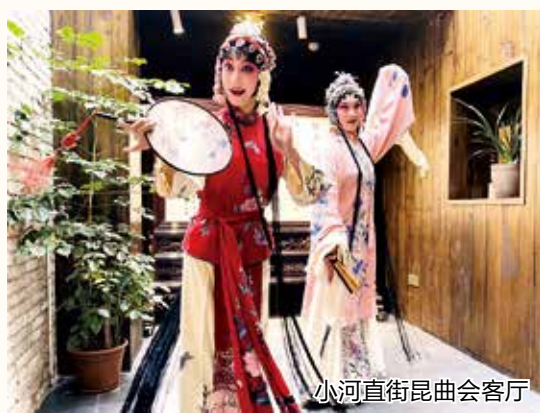
小河直街昆曲会客厅