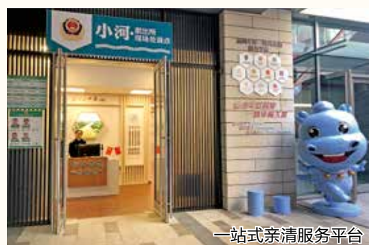
一站式亲清服务平台