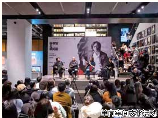
单向空间文化活动

构建大美小河·融媒体矩阵。开启小河“云”艺术,开展网上阅读节、网上艺术展、网上购物节,打造小河“云”生活,引入飞鸟与禾等数字传媒企业入驻小河驿·智序空间,打造数字内容输出高地,辐射影响近1亿人次。