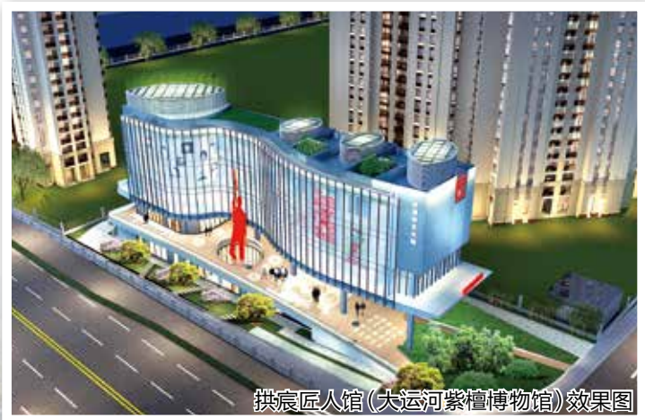
拱宸匠人馆(大运河紫檀博物馆)效果图

贤荟”，打造运河同心小镇统战品牌。坚持实绩优先，通过定期大比武、晒业绩，锤炼“说干就干，干就干好”“不说不能办，只说怎么办”18字拱宸铁军精神。在全区率先出台《干部政治品德和工作作风计分管理办法》，营造干事创业，风清气正的良好氛围。