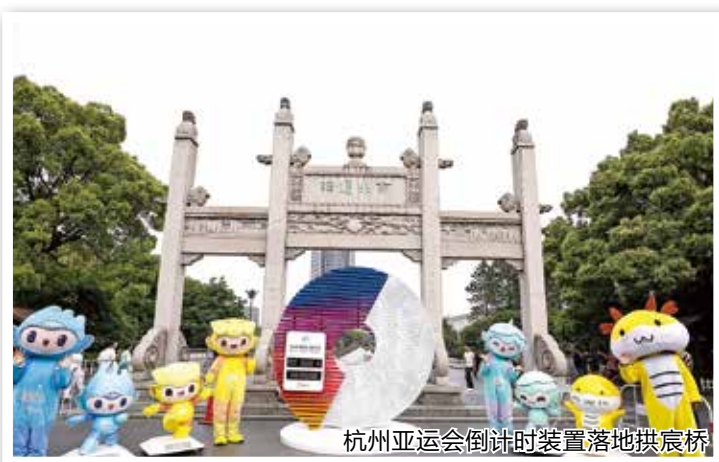
杭州亚运会倒计时装置落地拱宸桥

拱宸桥街道是拱墅区委区政府所在地，以横跨运河的明代三孔石桥——拱宸桥而得名，区域面积4.23平方公里，常驻人口8万人。拱宸自古繁华，曾是杭州丝麻产业的集聚区，如今拥有5大国家级博物馆和12个运河世界文化遗产申遗点。