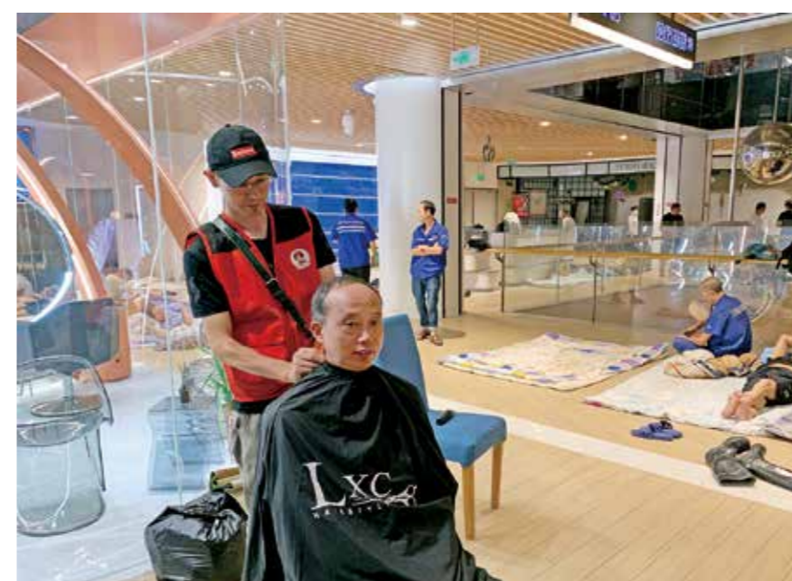
▲天水街道的志愿者们来到杭州大厦地下商城安置点为转移人员免费理发，将爱心服务送给工友们。

在拱墅，有那么一群人，闻汛而动、迎风前行，在狂风暴雨中留下美丽的背影。扫一扫观看《台风中的背影》视频。