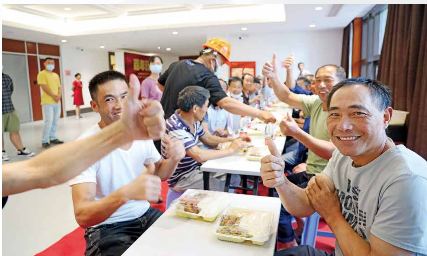
▲在浙江展览馆和杭州大厦地下商城安置点，志愿者为工友们分发饭菜，现场井然有序，大家围着长桌吃着可口的饭菜，安置点瞬间变成幸福“加油站”。

安置点外，充斥着狂风暴雨；安置点内，洋溢着欢声笑语……连日，拱墅各服务部门整合辖区中小学校、展览馆、体育馆等场所资源，为全区3万余名工友和群众转移提供了临时安置点。生活起居、疫情防控、文化活动等贴心服务，让安置点充满了家的味道。在这一个个温馨的避风港里，不断上演着暖心故事。