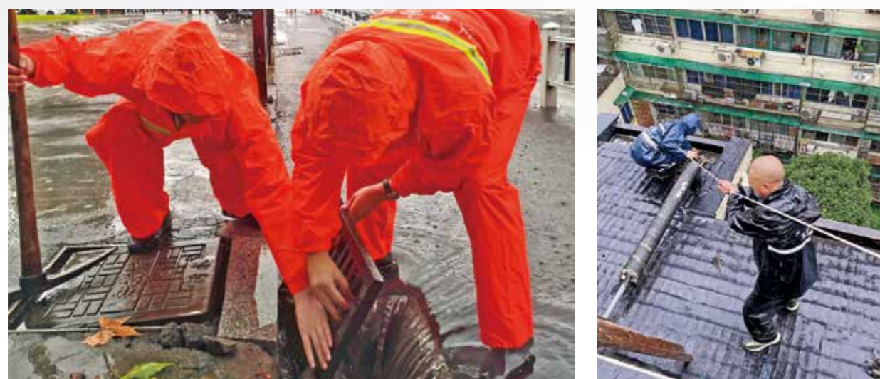
▲市政全程在线，无论是小区还是道路，哪里有积水，哪里就有他们的身影。

今年第6号台风“烟花”来势汹汹，省市区启动I级防台风应急响应。为守护群众生命财产安全，把台风影响降到最低，拱墅人风雨同舟、众志成城，他们的身影奋战在狂风暴雨中，挺立在急难险重处，奔走在白昼黑夜中……一个个不眠之夜，一双双熬红的眼睛，就是拱墅人全力以赴打赢防汛防台战役的生动注脚。