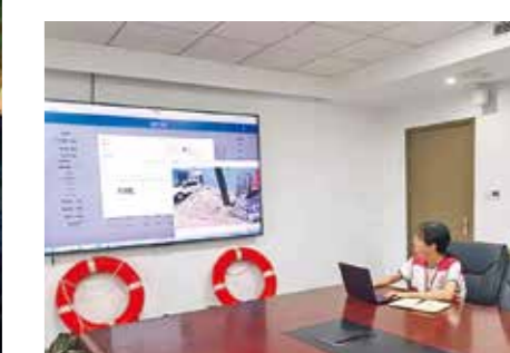
▲我区各街道指挥中心落实24小时值班制度，发挥数字驾驶舱反应灵敏、指挥高效的功能，加强辖区积水、路面交通、安全隐患、群众求助等情况实时监测处置、反馈，以数字赋能提升防汛防台能力。