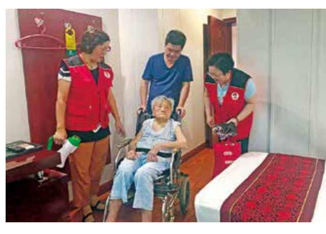
▲武林大妈志愿者挨家挨户上门走访，帮助孤寡老人做好物资储备，协助部分老人转移，提醒居民注意安全。