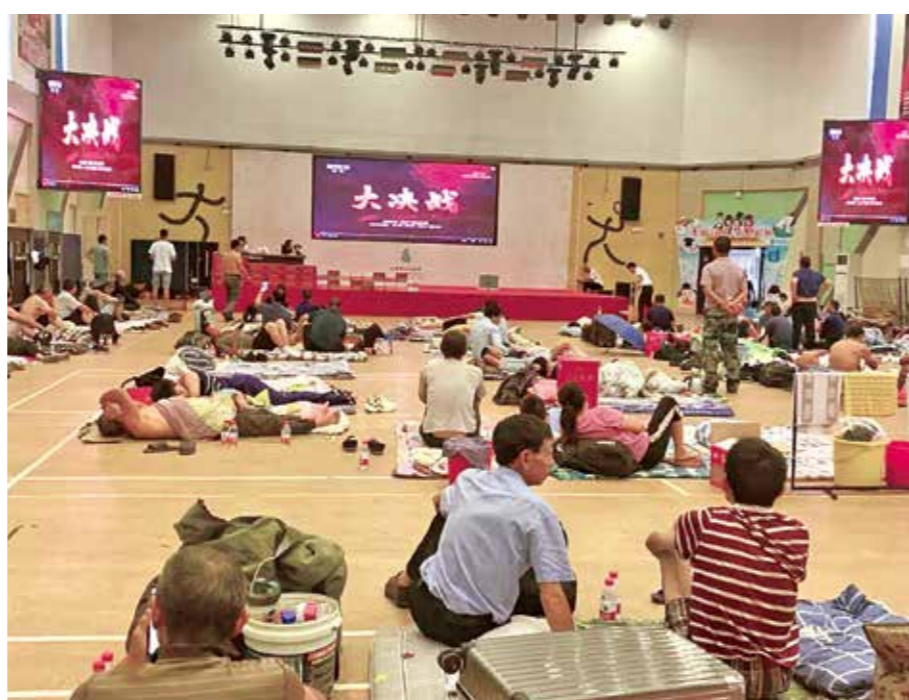
▲在小河小学安置点，红色大片《大决战》正在上演。影片带领大家重温了伟大征程，激发了众志成城防汛防台的信心和决心。