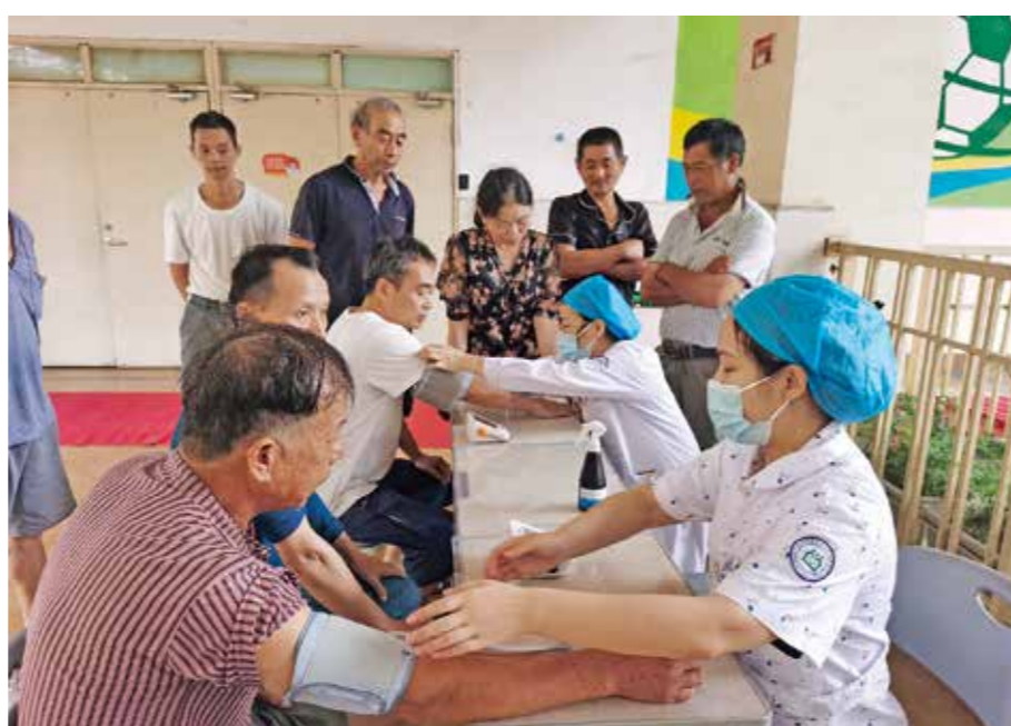
▲祥符街道社区卫生服务中心医疗小分队走进辖区临时安置点，为农民工兄弟免费测量血压血糖、健康问诊等。