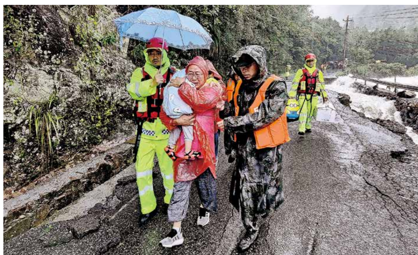
▲一方有难，八方支援。朝晖街道民兵连夜冒雨集结出发奔赴临实行跨区支援，帮助当地转移群众，大街小巷随处可见迷彩绿穿梭其中。