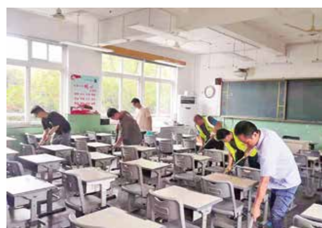
▲东新街道长青小学安置点的工友们撤离前主动恢复课桌椅、打扫卫生，不留下一点垃圾。

“谢谢你们这些天的照顾，再见了！”7月26日，在工作人员的引导下，拱墅各安置点的安置人员陆续返回原先的住处。全区各安置点在确保安全的情况下，有序做好撤离安置人员的返回工作。