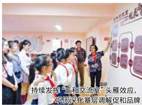
持续发挥“三和交流室”头雁效应,巩固深化基层调解促和品