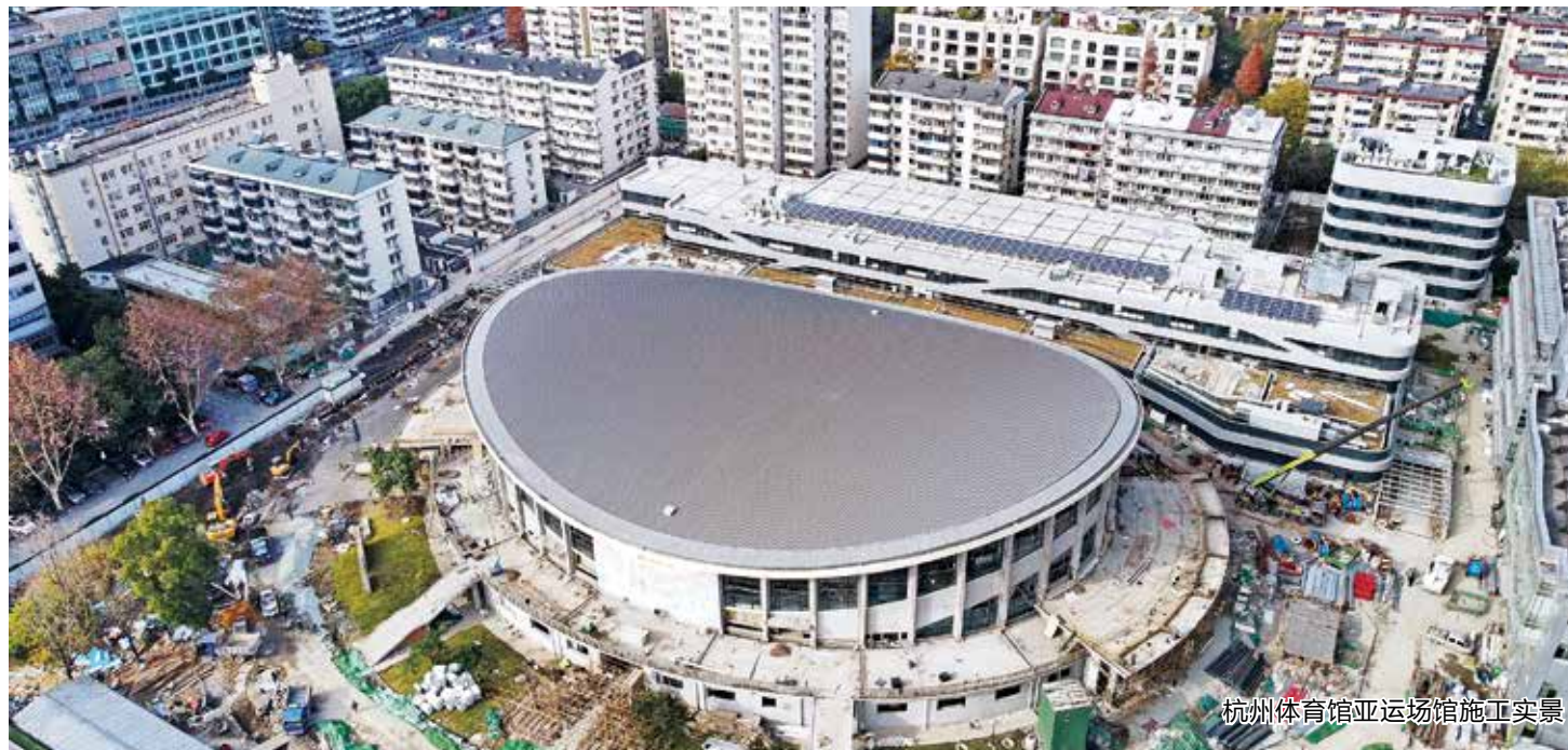
杭州体育馆亚运场馆施工实景图

持续巩固和深化“一支队伍管执法”、全省基层法治化综合改革试点成果,为基层治理赋能增效。强化应用场景探索创新,拓展“出租房及流动人口数智一体化”“数字化赋能综合执法改革”等应用场景,推动“长庆微脑·数字驾驶舱”更智慧、更灵活。纵深推进溯源治理工程,完善街道矛盾纠纷中心各项机制,打造“枫桥式司法所”,建立专兼结合的调解组织;持续发挥“三和交流室”头雁效应,巩固深化“党建+调解”“党建+家风”“党建+关工委”基层调解促和品。夯实平安建设工作基础,高水平做好党的二十大、杭州亚运会期间平安护航工作,推进全省基层应急管理(消防)站所创新试点工作,按标准建设吴牙社区应急体验馆、街道应急管理库。