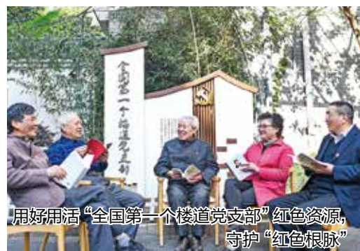
用好用活“全国第一个楼道党支部”红色资源,守护“红色根脉”

始终重视党的建设这一“基本盘”,认真贯彻落实新时代党的建设总要求,坚决传承好、守护好“红色根脉”。夯实政治建设“压舱石”。引导全街干部不懈强化理论武装、筑牢思想根基,增强政治判断力、政治领悟力、政治执行力;大力培育和弘扬社会主义核心价值观,让党的创新理论“飞入寻常百姓家”。提振干部队伍“精气神”。坚持用党史滋养初心、锤炼党性,健全“知行讲堂”理论学习机制,加快干部知识更新、能力培训、实践锻炼,推进党史学习教育常态化开展;充分运用“大数据”思维,建立干部信息库,通过精准画像、常态化分析等,提高选人用人精准度。激活基层党建“新引擎”。持续强化小区党组织建设,切实发挥“红色物管联盟”效用,构建“党建引领+基层治理、数字治理”三方协同小区微治理新格局;充分发挥楼道党支部自我管理、自我教育、自我服务、自我监督能力,开辟“居民议事厅”特色阵地,营造浓厚自治氛围;夯实两新党建工作根基,做实“支部+支部”建设,启动“红色代办”进楼宇等行动;一体推进“三联三领三服务”“驻万企帮万户”“访民情解民困”等实践工程;开展“最美人物”争创、“长庆好人”挖掘系列活动,弘扬正能量。站在新起点,长庆街道将对标对表“重要窗口”新任务、新要求,为奋力开创新时代高质量发展共同富裕示范新局面而不懈奋斗。