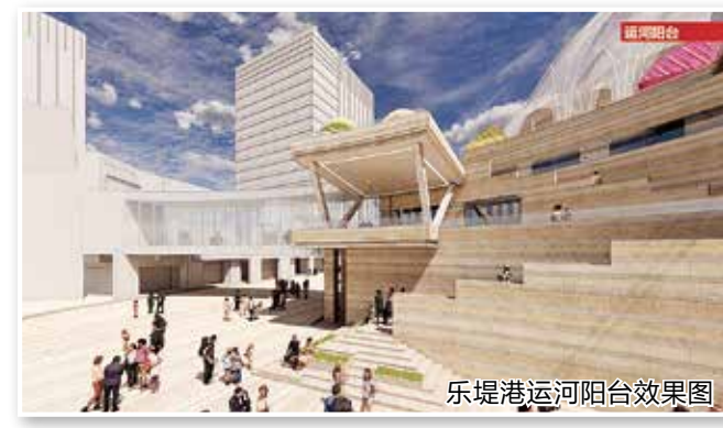
乐堤港运河阳台效果图