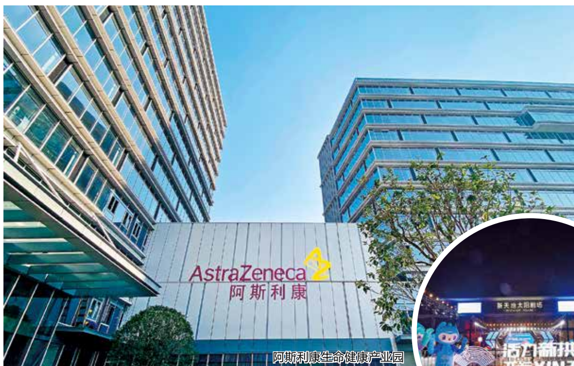
阿斯利康生命健康产业园

“2021年,东新街道以“新城新作为、争先争一流”的奋进姿态,抢抓行政区划优化调整释放出的区位优势、产业融合红利,经济社会民生各项事业收获满满、突破不断。 2022年是党的二十大召开、杭州亚运会举办的关键之年,东新街道将继续深入贯彻落实党的十九届六中全会精神和省市区要求部署,持续夯土筑基,坚持党建引领,释放党建赋能,扎实推进疫情防控常态化工作,在新时代新征程中扛起东新担当,在新拱墅新蓝图中展现东新作为!”