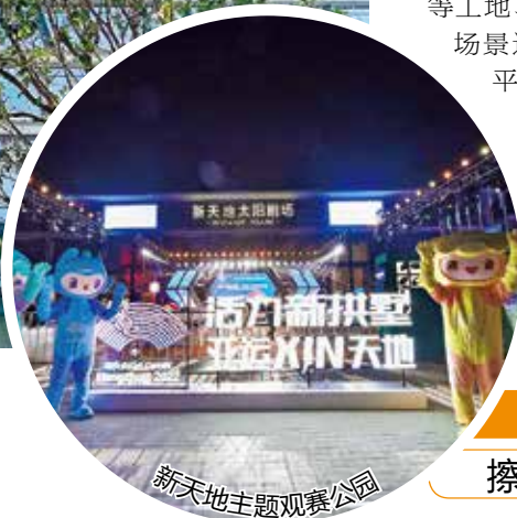
新天地主题观赛公园

发挥数字化改革全区领跑优势,深化行政执法改革和基层社会治理服务运行机制建设,推出更多管用、实用、好用的数字化改革成果。跑出基层治理加速度。依托“数治街区”场景和“东新微脑”闭环治理基础,加快“智慧工地”“食安慧眼”“智慧消防”等工地、餐饮等领域的数字化场景运用,构建一体化智治平台,着力推动数字化改革从“小范围试点”到“全领域应用”,显著提升街道基层社会治理能力。跑出环境品质提升加速度。紧抓亚运契机,继 续深入开展“美丽杭州”创建暨“迎亚运城市环境大整治、城市面貌大提升”工作,深化和完善“红旗班”城市管家全周期管理工作机制和“综合查一次”执法管控机制,高品质改善城市面貌。跑出未来城市建设加速度。进一步探索创新以商业区、居民区“共享”为核心的未来社区“万家星城模式”,加快将数字化改革“错峰停车”的经验做法在“三化九场景”中运用,打造具有东新辨识度的“未来社区2.0”方案。依托社区智治在线平台,线上线下共同发力深化社区治理,深化各年龄层面服务场景建设应用,让硬件设施与软件服务惠及千万家。