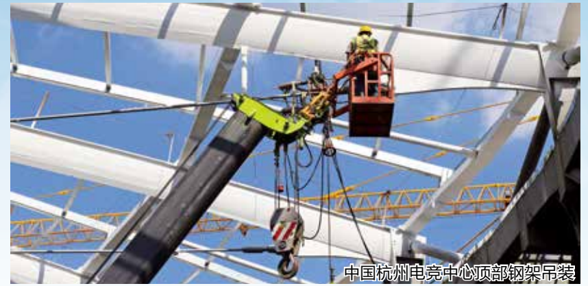
中国杭州电竞中心顶部钢架吊装

同为杭州亚运会场馆，运河亚运公园中的“玉琮”（体育馆）和“杭州伞”（体育场），也因独具匠心的造型而“出圈”。但“高颜值”往往意味着“高难度”，如“玉琮”（体育馆）外立面的钢结构和玻璃是“双曲双扭”，“杭州伞”（体育场）的“全面边缘”