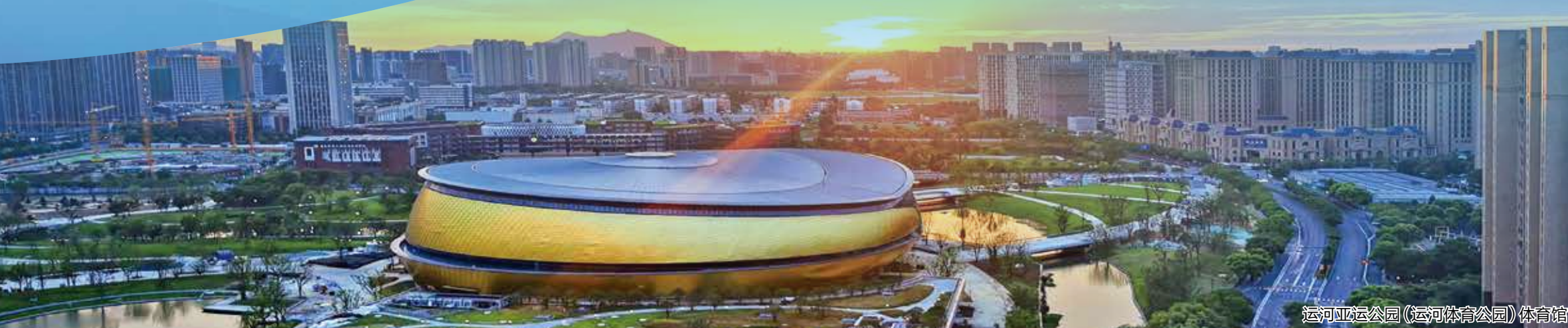
三塘安置房效果图

拱墅还进一步着力将“经验”转化为“标准”，支持属地企业杭州铁木辛柯建筑结构设计事务所有限公司参与中国工程建设标准化协会关于《隐式钢管混凝土结构技术规程》的编制工作，浙江工业大学工程设计集团有限公司参与《疏浚淤泥质地建筑地基基础技术规程》的编制工作，浙江省建材集团有限公司参与《预拌混凝土质量管理标准》编制工作等，在装配式建筑行业规范、地方标准的编制工作中不断走深走实，反哺行业更高水平转型升级。