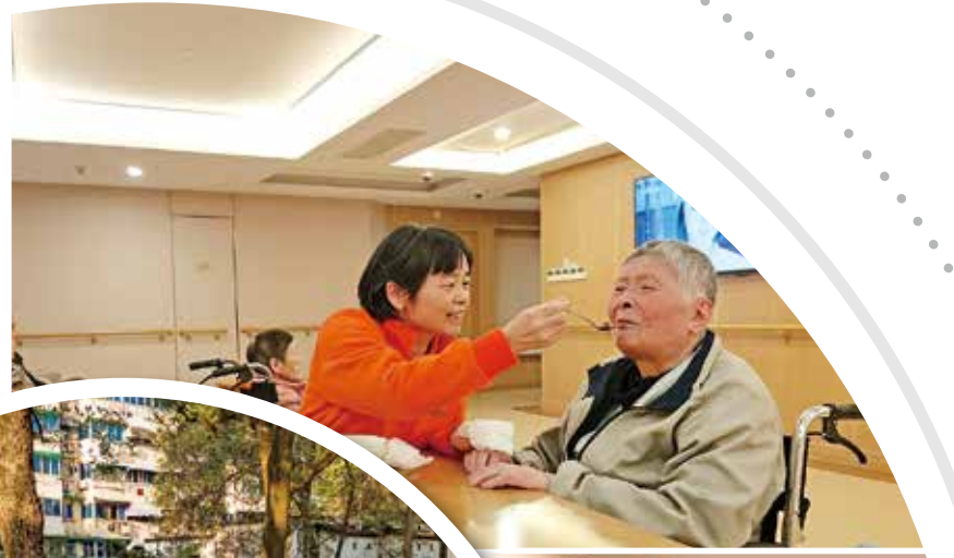
老人在机构接受康复照护