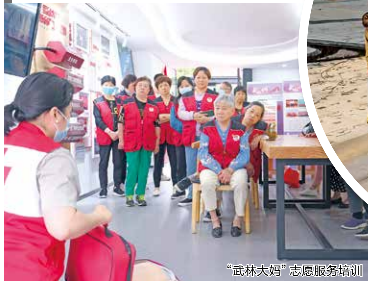
“武林大妈”志愿服务培训