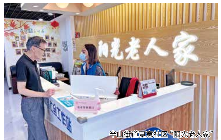
半山街道夏意社区“阳光老人家”

针对老年人探访服务工作量大面广的难点痛点,拱墅区创新老年人安居守护“五色探访”治理模式,每年实施“安居守护”民生实事工程,贯通上门探访服务、中心呼叫服务等“线上+线下”多平台多类型数据,健全“预警—派单—响应”闭环,今年1—10月,累计处理预警信息1.85万余条,救助老年人60余次,形成“人在走、数在转、云在算”的老年人安居守护智慧养老新模式。