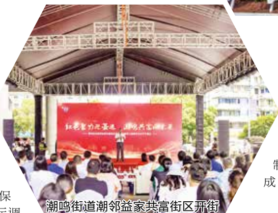
潮鸣街道潮邻益家共富街区开街

天竺社区成功入选首批浙江省现代社区、首批省级“红色根基”强基示范社区,被认定为全区唯一2023浙江省星级社区服务综合体。