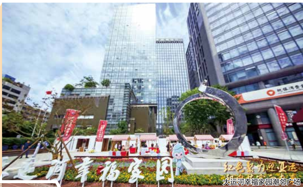
大运河幸福家园潮邻广场

方一般公共预算收入7.63亿元,固投4.15亿元,规上其他营利性服务业营业收入11.20亿元,同比增长91.6%,限上餐饮业营业额1.67亿元,同比增长21.1%,增幅居全区第一。