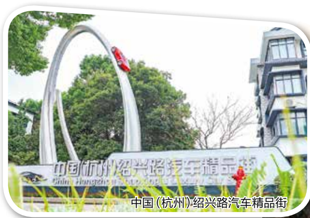
中国(杭州)绍兴路汽车精品街

成为全省唯一“宁静小区”国家试点,成果获国家生态环境部实地调研肯定并在全国噪声专项会议上点名表扬。率先完成万家星城小区28处3600平方米消防登高面问题整改。创建全省首批“枫桥式”检察室,形成全省为企法治服务样板。