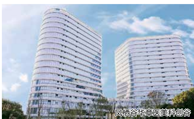
凤栖谷华章医美科创谷

成为全省唯一“宁静小区”国家试点,成果获国家生态环境部实地调研肯定并在全国噪声专项会议上点名表扬。率先完成万家星城小区28处3600平方米消防登高面问题整改。创建全省首批“枫桥式”检察室,形成全省为企法治服务样板。