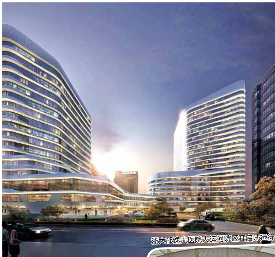
浙大邵逸夫医院大运河院区开启试运行

绘就“全国健康区”画卷。在连续5年获得健康浙江(杭州)考核优秀的基础上,做好“一地一品、一地一标杆”健康行动样板培育工作,深化全国社会心理服务体系试点,做好重点税源、双百企业家及高层次人才健康管理服务,助力打造一流营商环境。