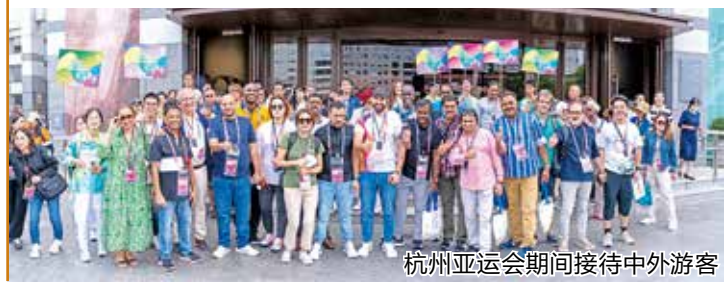
杭州亚运会期间接待中外游客

出台《高质量推进公共文化服务体系实施意见》,打造“15分钟品质文化生活圈”、“10分钟健身圈”,全省公共文化服务现代化发展指数(CMDI)排名全省第七,全市第二。《加快建设“一河二带五圈”嵌入式体育场地,奋力打造拱墅特色标志性体育空间》项目入选健康浙江行动示范样板与优秀案例。新建嵌入式体育场地296个,新增面积超6万平方米。