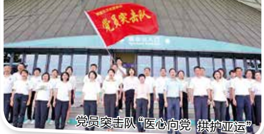
党员突击队“医心向党 拱护亚运”

时序轮替,见证奋斗足迹;万象更新,勇创新的成绩。区卫生健康局将坚决紧紧围绕区委区政府部署要求,以“健康惠民”的实际举措助力“三城五区”和大运河幸福家园的建设,加快推动全区卫生健康事业高质量发展,为拱墅群众铺就“安心放心”的健康路。