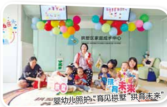
婴幼儿照护“育见拱墅 拱育未来”