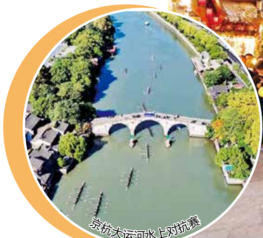
京杭大运河水上对抗赛