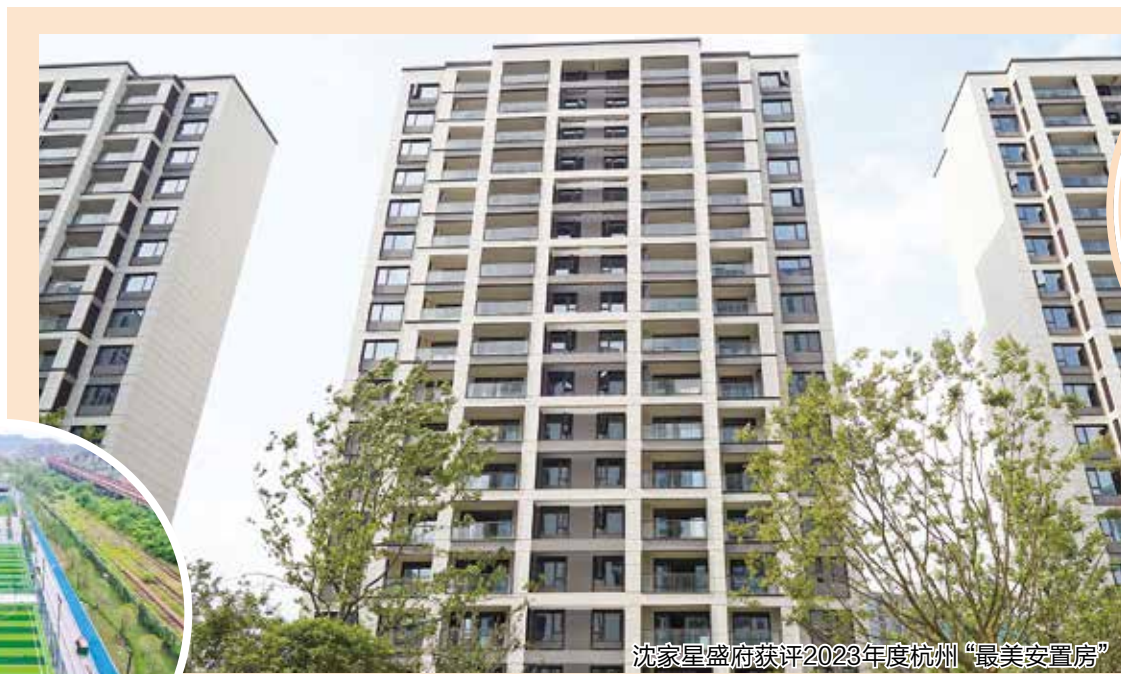
沈家星盛府获评2023年度杭州“最美安置房”

2023年,区域建集团全面学习贯彻党的二十大精神,积极践行“八八战略”,持续深入落实中央、省、市、区各项决策部署,凝心聚力、苦干实干,深耕城市空间优化和品质提升,深入推进亚运“三大提升行动”,全力以赴加快回迁安置、土地利用、开发建设、资产运营、产业招商等各项工作,为拱墅区推进“两个先行”,高水平打造时尚之都、数字新城、运河明珠,奋力开创拱墅新时代高质量发展共同富裕示范新局面而贡献城建力量。