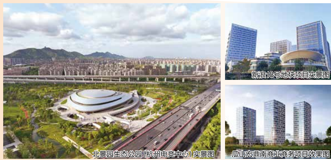
新康18号地块项目实景图

2023年是区产投集团站在国企改革新起点上,开创新局面、实现新发展的第一年。集团上下深入贯彻区委区政府决策部署,锚定“三城五区”建设总体目标和大运河数智未来城省级高新区创建任务,开拓创新、锐意进取,以有力的举措推动各项工作落地见效,为全面绘就中国式现代化拱墅实景图助力赋能。