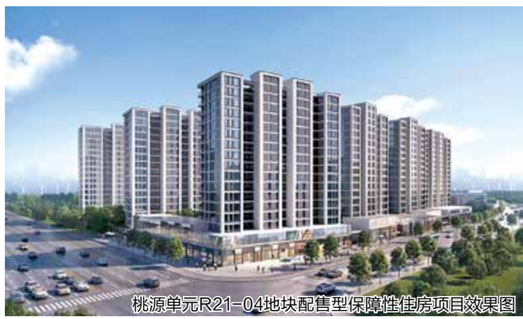
桃源单元R21-04地块配售型保障性住房项目效果图

会议指出，规划建设保障性住房是党中央、国务院作出的重大决策部署，是完善住房制度和供应体系、重构市场和保障关系的重大改革。要适应新型城镇化发展趋势和房地产供求关系变化，准确识变、科学应变、主动求变，加快构建房地产发展新模式，要深刻认识把握推进保障性住房建设的重要意义，加大保障性住房建设和供给，完