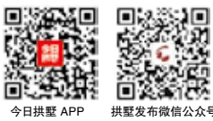
今日拱墅 APP 拱墅发布微信公众号