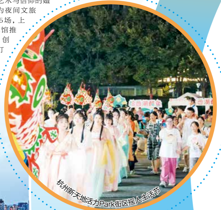
杭州新天地活力Park街区烟火生活节