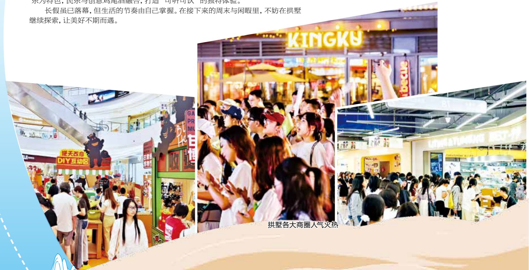
拱墅各大商圈人气火热

夜幕降临, 武林夜市热闹开启。汇入人潮, 空气中满是小吃的气味, 目光所及是文创产品与霓虹灯牌的交织, 感受沸腾的夜晚。胜利河美食街是杭城记忆里的“市井烟火地”, 更是官方认证的杭城唯一国字号特色美食街区。若想寻觅宵夜, 这里是必选之地。城市其他地方渐渐静谧时, 新天地活力PARK的夜晚才刚刚开始。天南地北的小吃、快餐价格亲民, 购物、娱乐、餐饮、艺术、演艺形成的夜生活闭环, 是这里的特色。早已成为市民和游客的热门打卡地。在这人间烟火中, 能找到最踏实的慰藉。周末夜晚, 不妨用一杯特调酒画上句点。邀上好友, 寻一处不吵不闹的酒吧, 让时间随音乐慢下来。“繁星Stars”高颜值杭州中心四季酒店30层, 以夜空为灵感, 拥有270度城市视野, 氛围静谧而浪漫。“LIBA空中花园餐吧”坐拥运河夜景与都市霓虹, 露台开阔, 是商务小聚或浪漫约会的优选。“月亮与六便士”藏于大兜路, 复古温馨, 艺术气息浓厚, 是喧嚣中的理想栖息地。“花符酒肆”则以国风即兴音乐为特色, 民乐与创意鸡尾酒融合, 打造“可听可饮”的独特体验。长假虽已落幕, 但生活的节奏由自己掌握。在接下来的周末与闲暇里, 不妨在拱墅继续探索, 让美好不期而遇。