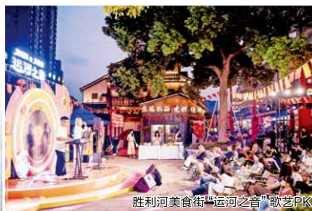
胜利河美食街“运河之音”歌爱PK

全区涉旅消费达40.7亿元, 酒店接待过夜游客达25.03万人次, 酒店客房平均出租率达77.8%。