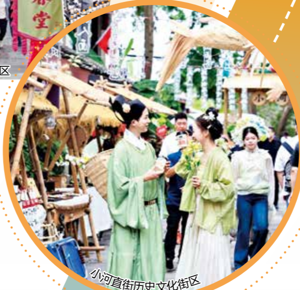
小河直街历史文化街区